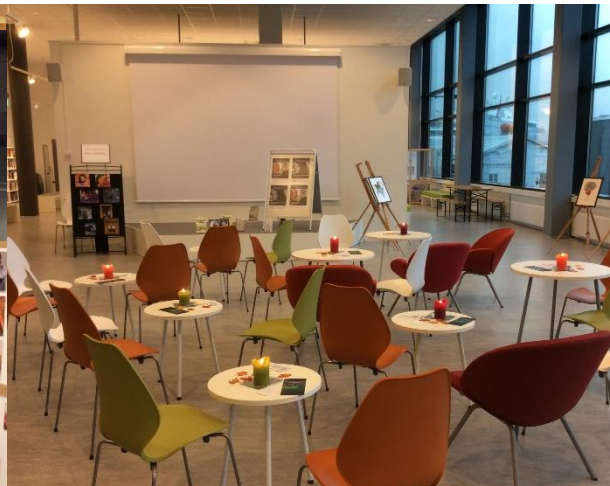
Arena for arrangement.