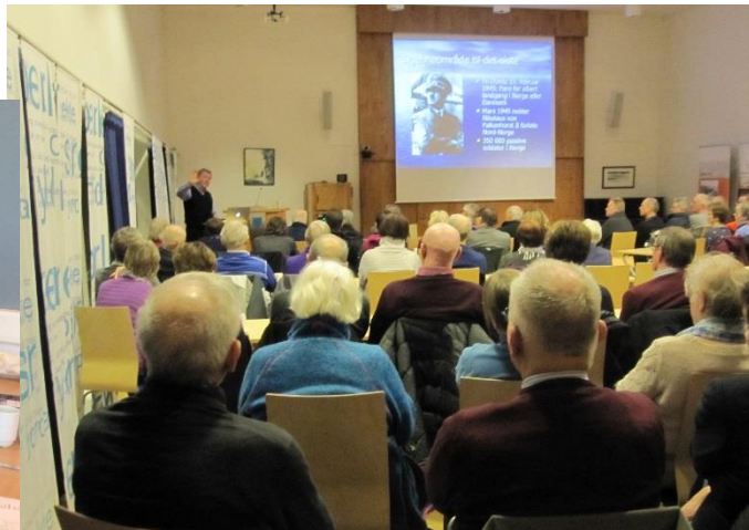
Foredrag om 2. verdenskrig.