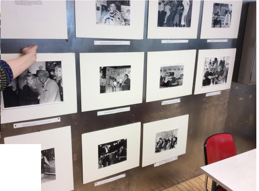
Litteraturhusteamet på besøk på Notodden bibliotek Mye å lære av å se andre bibliotek