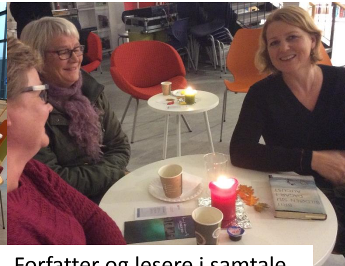
Forfatter og lesere i samtale.