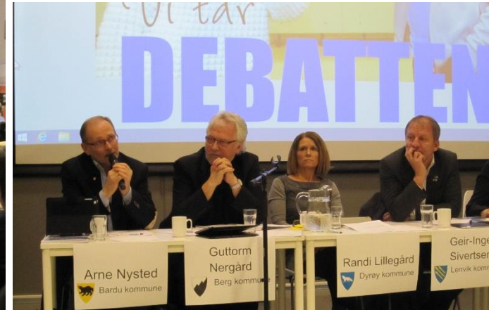
Debatt om kommunesammenslåing