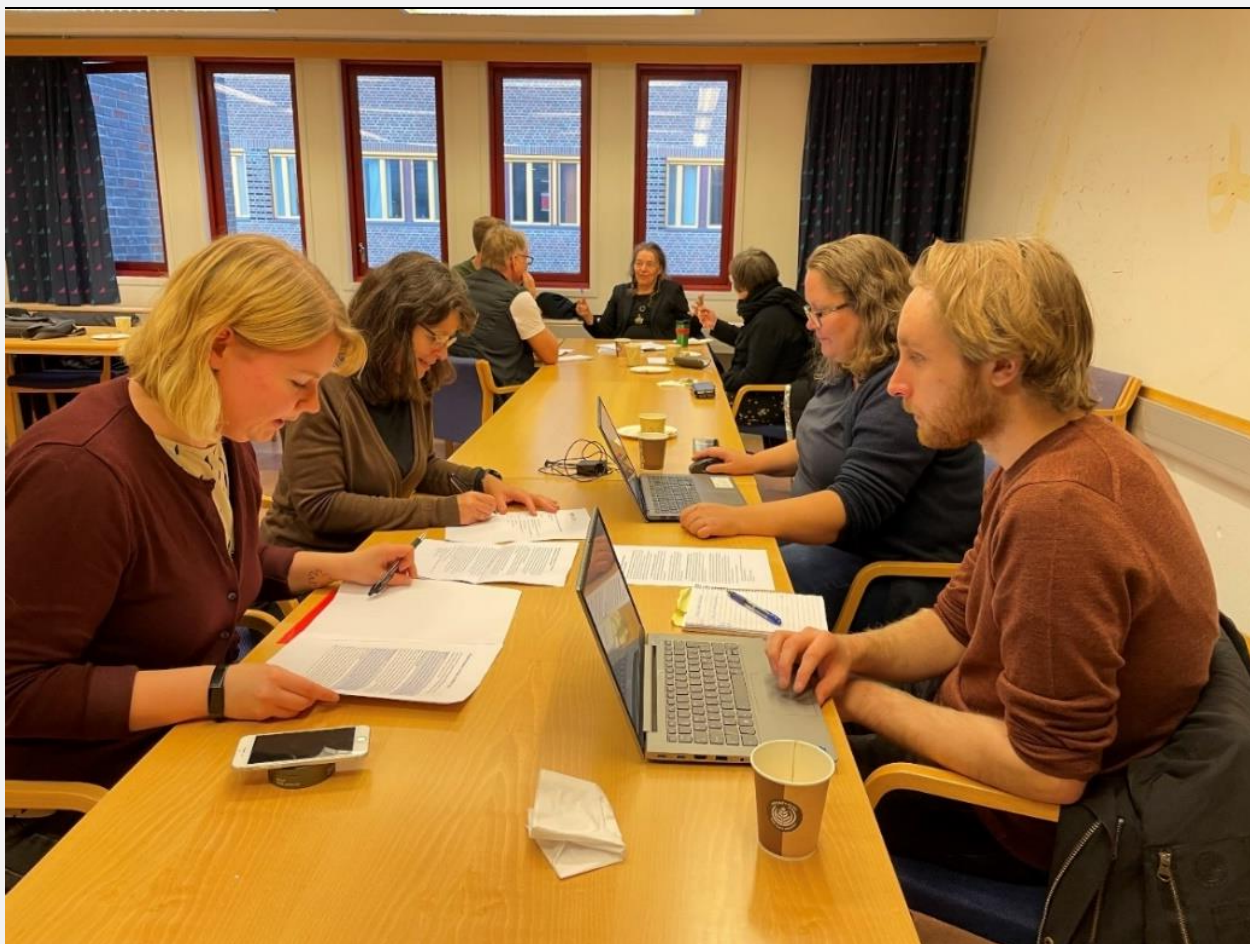
Fra strategiarbeidet i Statsarkivet i Tromsø høsten 2022. Gruppene i diskusjon.

Gruppene konstaterte at hvis museene og bibliotekene skulle jobbe videre med innsamling og oppbevaring av privatarkiver må arkivfaglig kompetanse for å jobbe med privatarkiv i museer og bibliotek på plass. Kompetanseutvikling kan gjøres gjennom nettverk: Man må bruke hverandre i nettverket til å kurse hverandre og å være bevisste på at vi sammen besitter mye kompetanse og kan være en kraft.