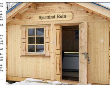
BUTIKK: Slik ser fylkets første reinkjøttbutikk ut.

Ronny Træblich 119 6170 rask@folkebladet.no