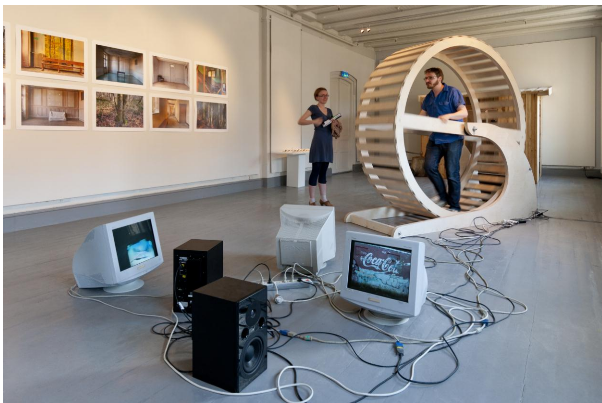
Bachelor avgangsutstilling Kunstakademiet UiT, Tromsø kunstforening 2010