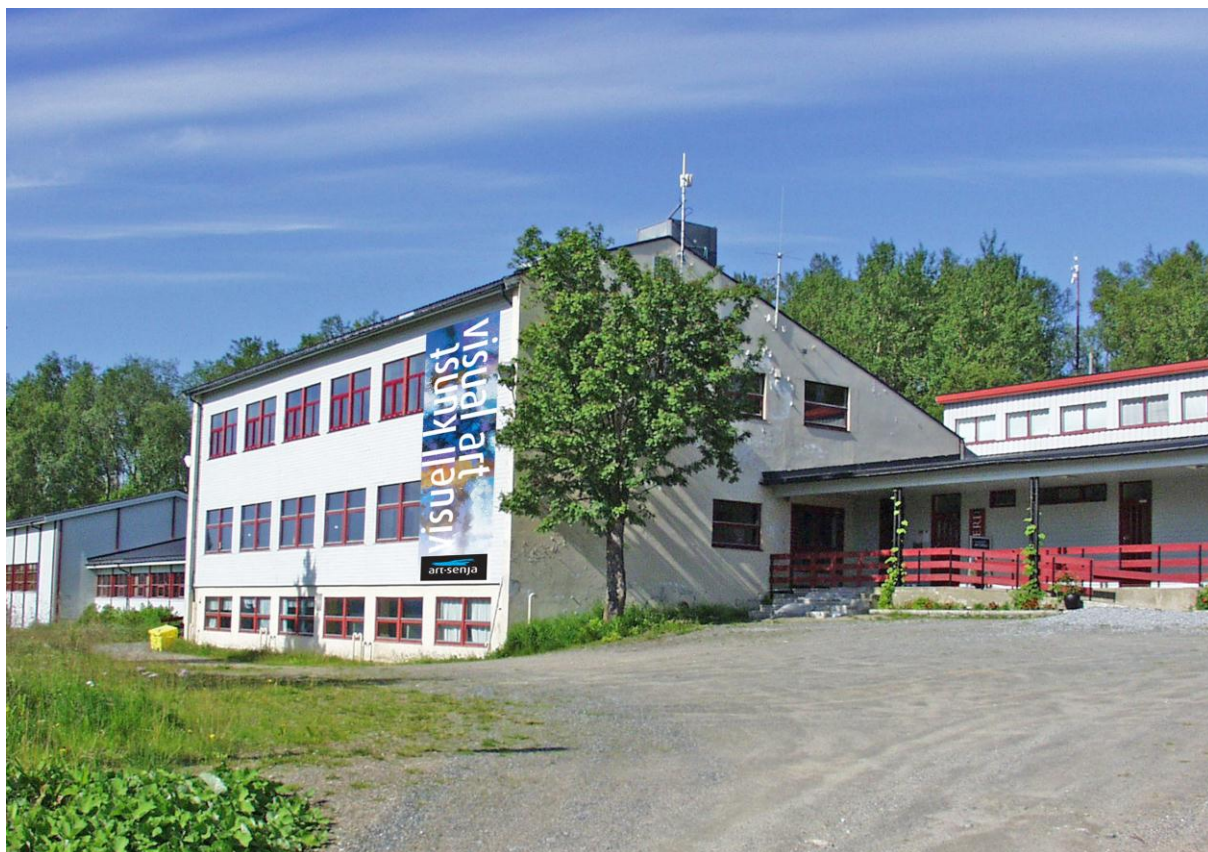
Fasade ArtSenja, 2011