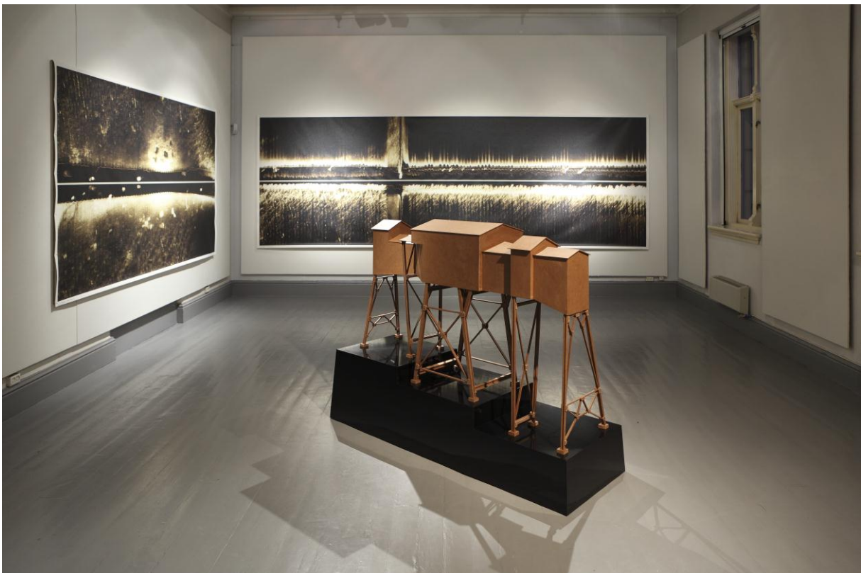
Marius Dahl – Receptor, Echoes 2, Echoes 3 , PolArt, Tromsø kunstforening 2009