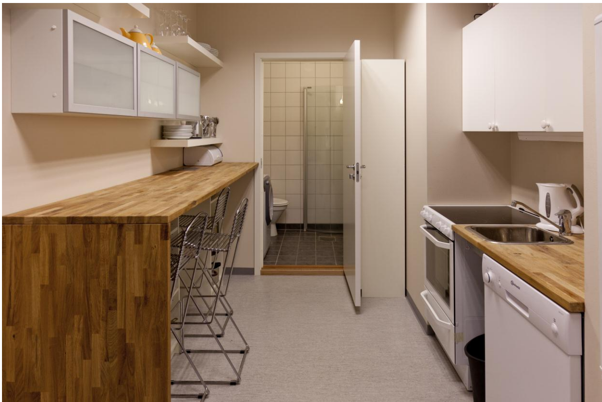
Kjøkkenen gjesteatelieret, Troms fylkeskultursenter 2011