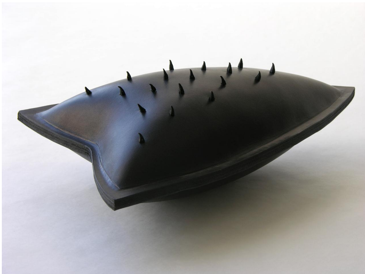
Solveig Ovanger – Motstand , 2005