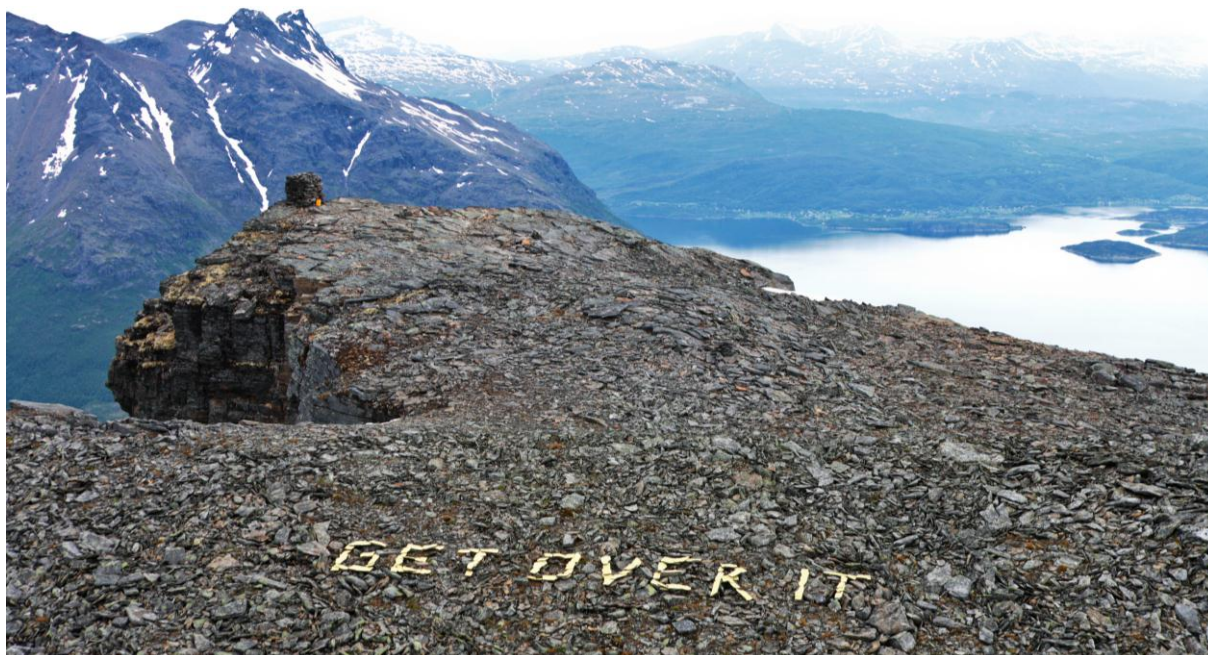
Ane Sagatun – GET OVER IT, Årbostadtinden 2010