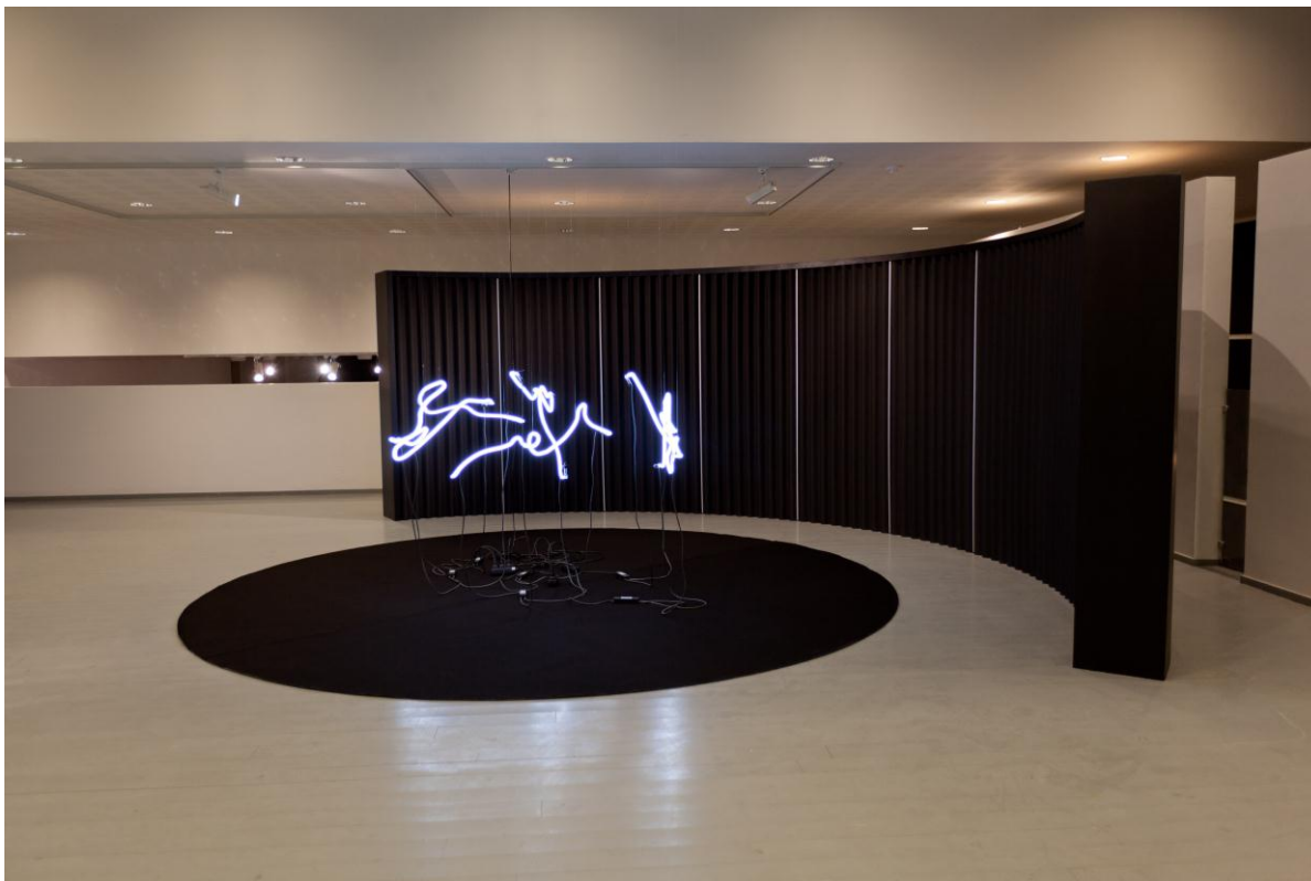
Børre Sæthre – Untitled (High Velocity Splatter) , Galleri Nord-Norge 2010